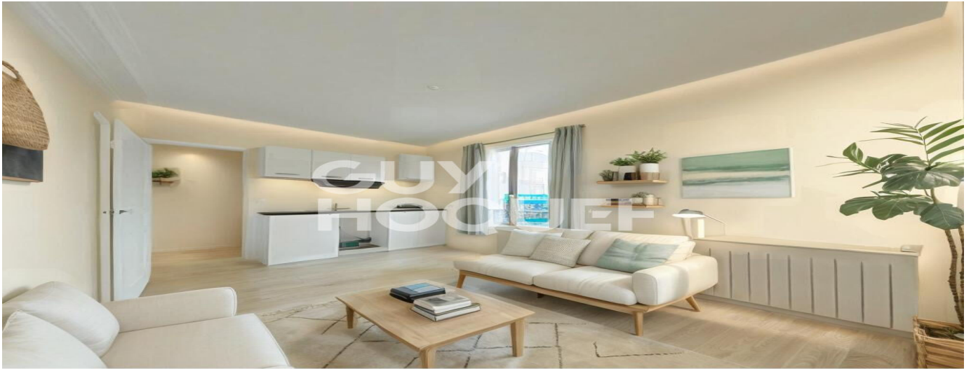
Proposition d'aménagement virtuel non contractuelle proposée par Flaash.ai