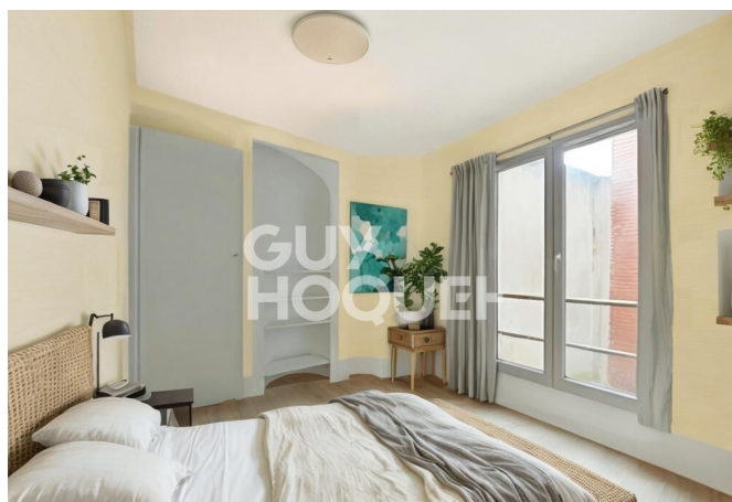
Proposition d'aménagement virtuel non contractuelle proposée par Flaash.ai